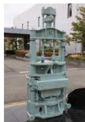
セルロイド製造試験機(圧搾機)

1900年代、日本でも原料生地が国産化され始めたセルロイドは、幅広い生活用品に使われ、人々の暮らしを豊かにしました。しかし、第一次世界大戦による特需が国内セルロイドメーカーの乱立、業界の過当競争につながり、粗製乱造による品質低下や、原料の一つである、樟脳の乱獲(樟樹の乱伐)を招きました。