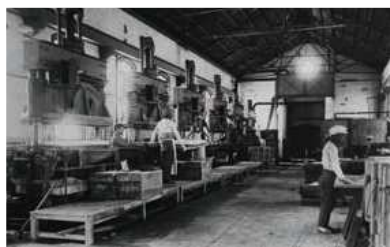
ダイセルの祖業である木材を原料とするプラスチック「セルロイド」の製造工程